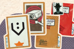
手がかりトークン 45個