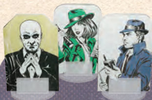
スタンド 8つ 各トークンは上図のように スタンドに組み合ませます。