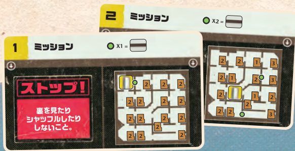
ミッションカード 41枚