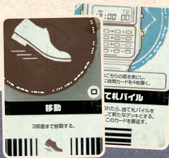
アクションカード 4枚 捨て札パイルカード 1枚