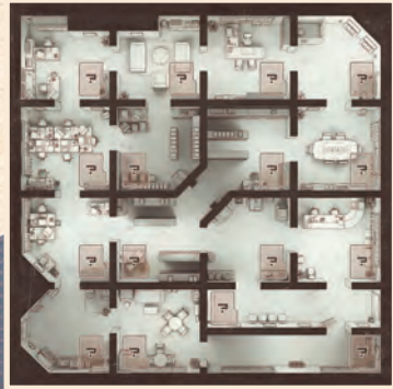
ゲームボード(両面印刷) 1つ