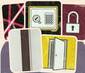
特殊設備トークン 14個