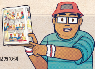
読み上げ中のページの見せ方の例

コミックを読む際は、この本を折り返して、指定のページのみが見えるようにしてください。読み上げている間、全員にも見えるようにした方が良いでしょう。特に指定がないかぎり、ページはすべて読み上げます。