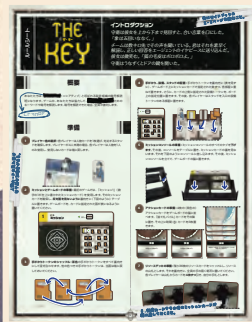
「ザ・キー」ルールシート 1部