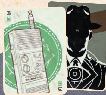
リソースカード 40枚